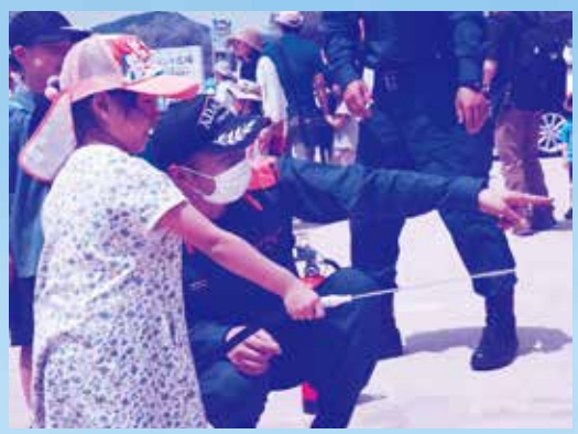
★放水体験★ 放水開始！