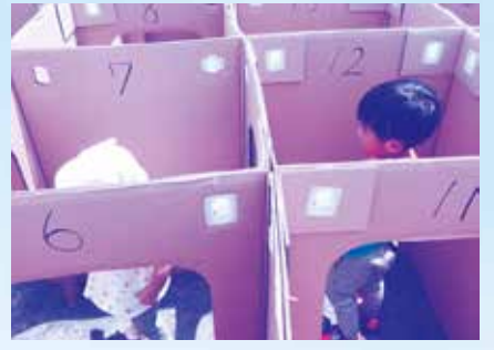
★段ボール迷路★ 迷っています