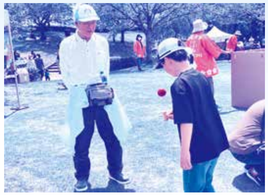
★けん玉★ おっ！うまいぞ