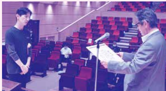
感謝状を受ける (一社)リトルオリーブ子ども基金 様