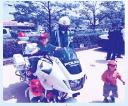
★白バイ★ ぼく、カッコイイでしょう