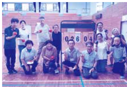
ゲームを通してすっかり 仲良くなりました。