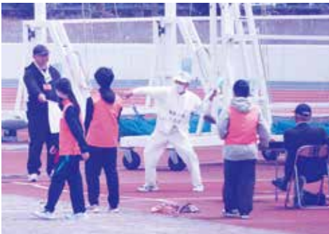
槍の代わりに「ターボジャブ」と呼ばれる投てき物を使う「ジャベリックスロー」

スポーツで育む多様性の理解と地域共生社会の実現 第61回福島県障がい者スポーツ大会が5月14日、21日の2日間にわたって、いわき市をメイン会場に、福島市、会津若松市など3市において開催されました。 当日は雨の心配もありましたが、開会式の時間には運よく晴れて、気持ちよく大会が開催されました。 本宮市身体障がい者福祉会からは5名が選手として参加され、日頃の練習の成果を発揮して目覚ましい活躍を見せ、各種目で上位入賞を果たすことができました。