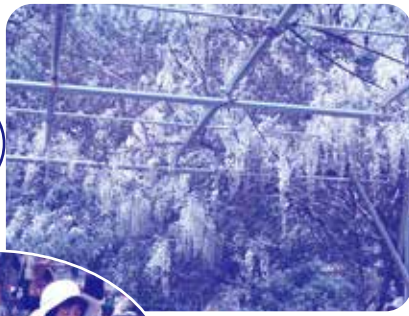
晴天の下 『しらふじ庵』の お披露目です

この春、ふれあいサロンの世話人の方たちと一緒に、畑の中の大きな白藤の周りの雑草を刈り、新たに藤棚を組んで住民のお休み処『しらふじ庵』を整備しました。