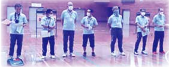
福島県障がい者スポーツ指導者協議会 県北支部のみなさん