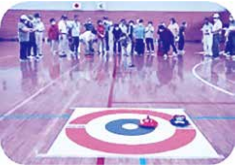
フロアカーリング