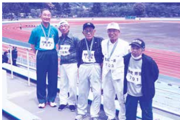
大会参加者の皆さん。好成績で笑顔がこぼれます。