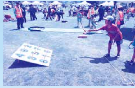
★輪投げに挑戦★ 1、2、3 ソレー