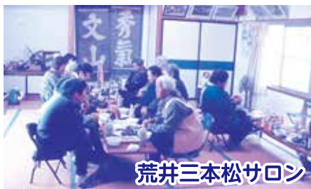
荒井三本松サロン