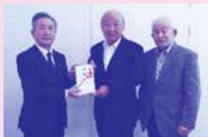
本宮市まゆみクラブ連合会様