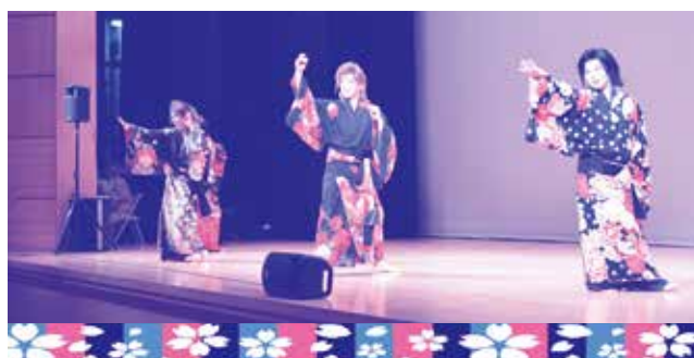
きらびやかな舞踊ショー手拍子で盛り上がりました