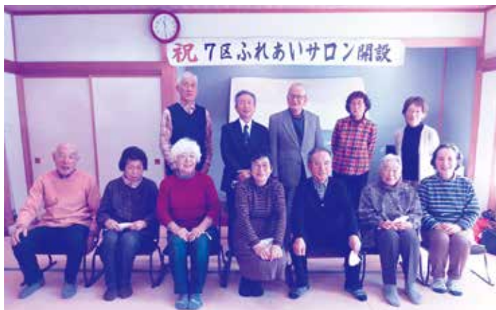
笑顔いっぱいの楽しいサロンを目指していきます！