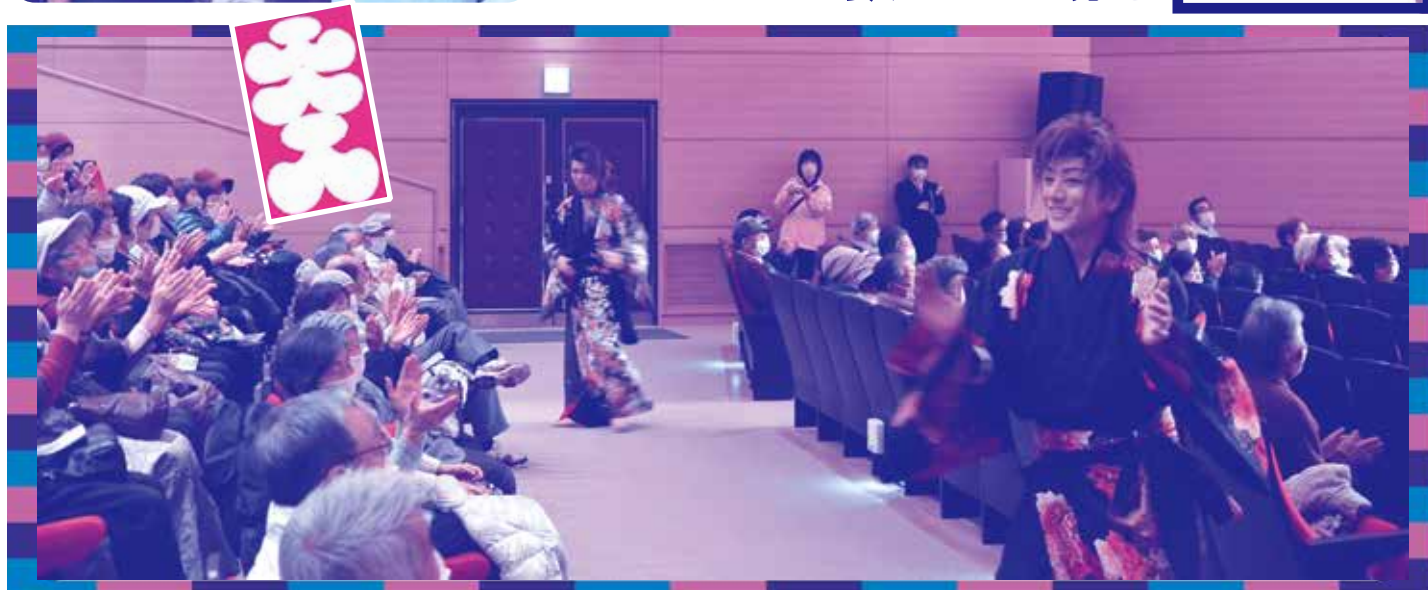
ステージから下りてきて目の前で華麗に踊る姿に歓声が上がりました