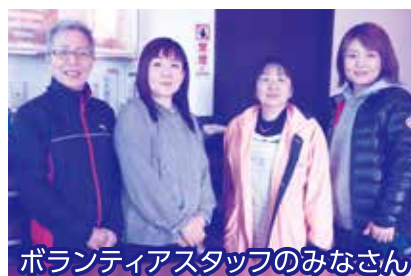
ボランティアスタッフのみなさん

みずいろ子ども食堂では13区集会所でも月に1回、フードロスを減らす取り組みとして食材の配付を行っています。 「もったいないをありがとう！」という観点から、様々な団体や企業から提供された食材を、おいしく食べていただける家族へお渡ししています。