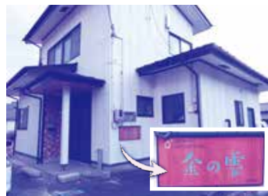
「金の栗」のすてきな看板が目印です

本宮6区の館町住宅地内に「金の栗」という看板を掲げた一軒家があります。ここでは毎月1回「しずくカフェ」が行われています。 しずくカフェには、毎回15人程の親子が集まり、みんなで調理をして和やかにランチを楽しんでいます。