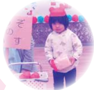
みんな食べてしまったのは 「あとの人に おきのどく」 セリフも上手に 言えたね。