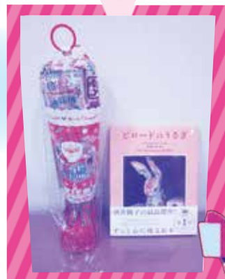
(一社)リトルオリーブ こども基金様より いただきました。