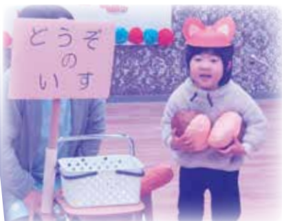
劇遊び 『どうぞのいす』