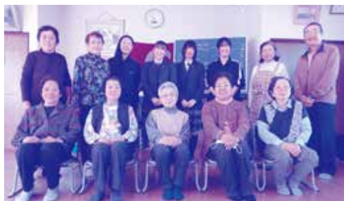
高木第5町内会サロン