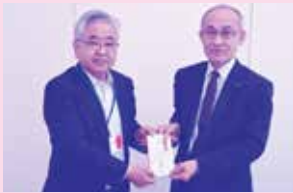
二本松優良申告法人のつどい様