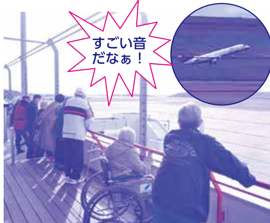
展望デッキから飛行機やヘリコプターの離陸の様子を見ることができました。