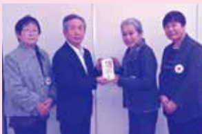
本宮市白沢赤十字奉仕団様