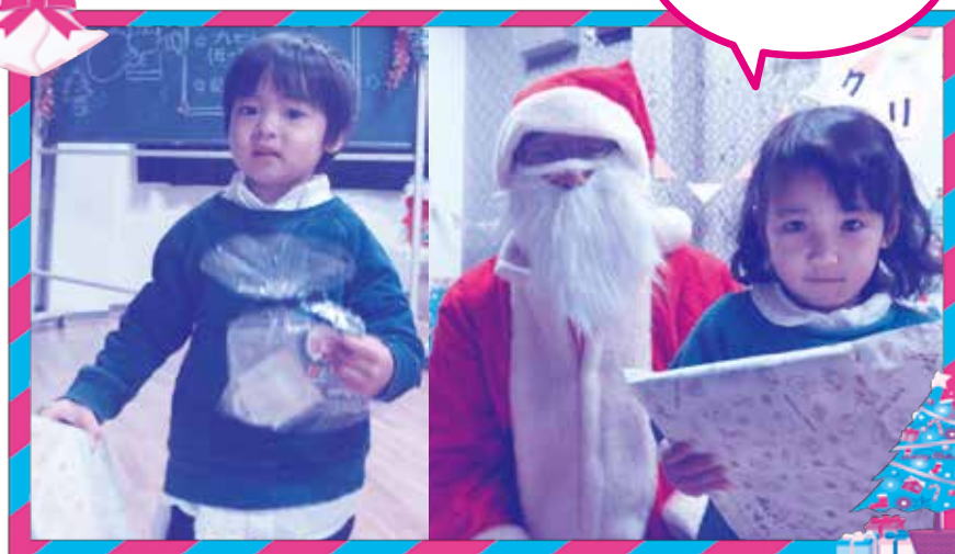
サンタさん プレゼント ありがとう♡