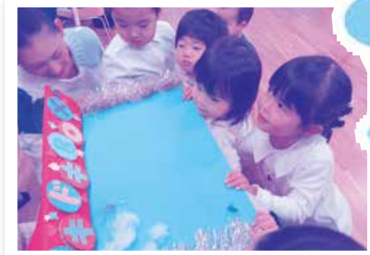
『ドキドキBOX』 箱の中身は なんだろう？