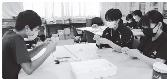
ビーズのプレスレットを作っています 淡い色の配色がステキ♡

それぞれのグループごとにアイディアやうまくいくコツを出し合い黙々と、また時には楽しそうに作品作りに励んでいました。