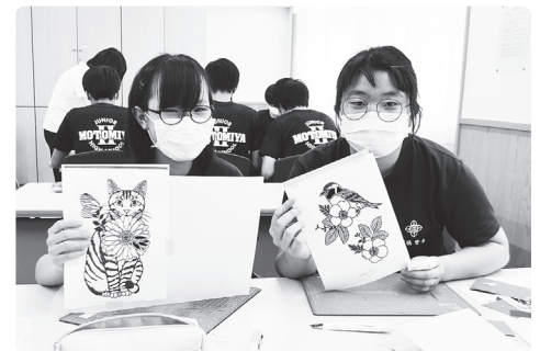
「この図案の切り絵を作ります」