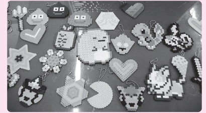
色とりどりの作品が完成！