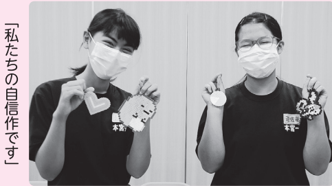
「私たちの自信作です」