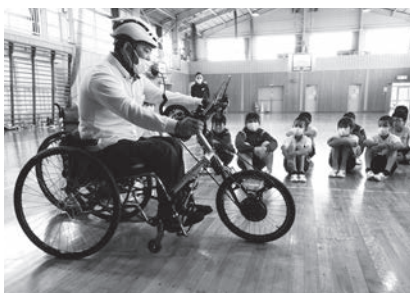
車いすとの違いも教えてもらいました。