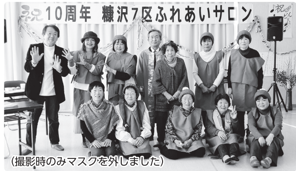
(撮影時のみマスクを外しました)