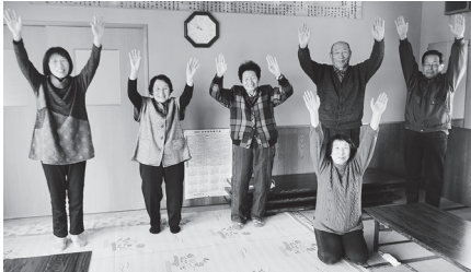
(撮影時のみマスクを外しました)

寒い日でしたが、肩や首回りをほぐす体操をして心も体もポカポカになり、和やかなひと時を過ごしました。