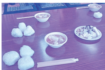
温かい汁物とおむすびの炊出し