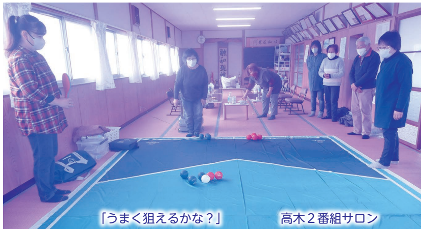
「うまく狙えるかな？」