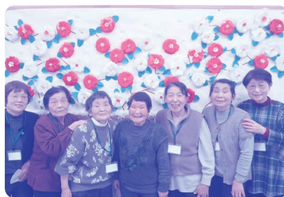
「寒椿」壁画作成。きれいでしょ♡