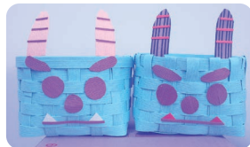
エコクラフトテープで鬼カゴ作り

一緒に楽しく活動してみませんか？ いきがいサービスひかりでは、65歳以上で元気に活動してみたい方を募集しています。お花見や紅葉狩りに出かけたり、レクリエーション活動など。 楽しいことがたくさんあります。一度体験してみませんか？ お友だちを誘ってもOKです。お気軽にお問い合わせください。