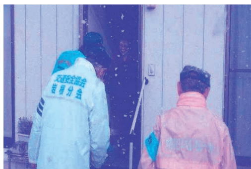
「変わらないかい？」と声をかけます