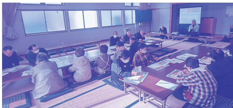
様々な災害に対しての対策を学んだ住民のみなさん