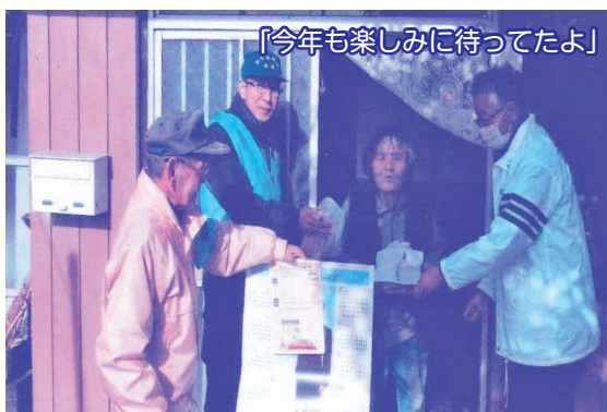
「今年も楽しみに待ってたよ」

また12月15日には、近年各地で頻発している自然災害に備えるために、下樋・梅原集会所で防災訓練を実施し地域住民25人が参加しました。