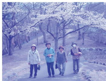
みんなでのお出かけ楽しいです♪