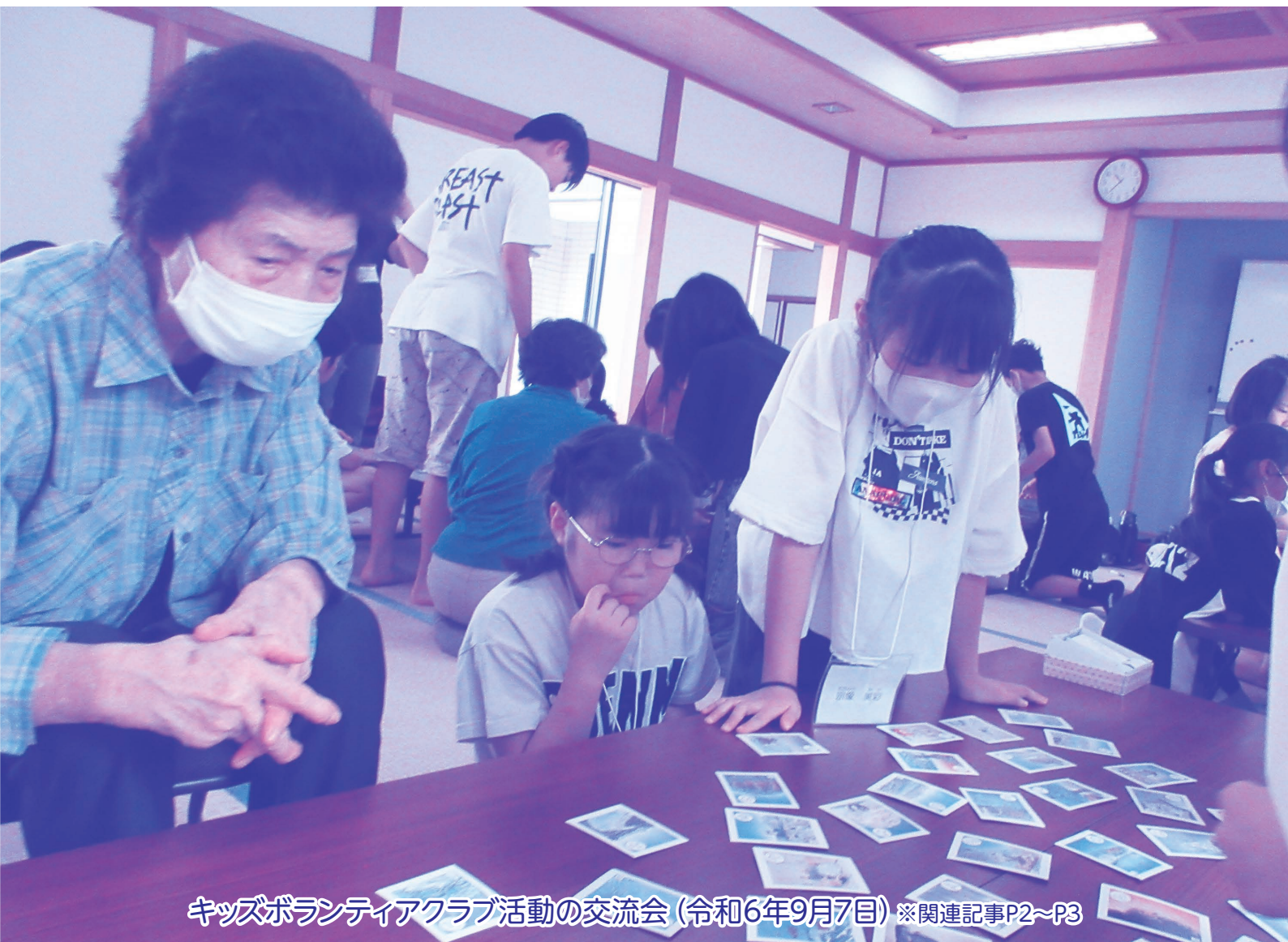
キッズボランティアクラブ活動の交流会（令和6年9月7日）※関連記事P2～P3