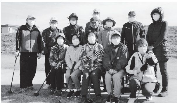
久しぶりで楽しかった♡

市内3か所の復興公営住宅を対象とし、住民同士の交流と親睦をはかるために「パークゴルフ大会」を行いました。冷たい風も吹きましたが秋の晴天に恵まれ、グループに分かれてプレーし、あちこちで「やったー」「おしい」などの声も聞かれ、風にも負けず楽しくプレーをしていました。初心者には経験者が、クラブの持ち方やボールの打ち方、コースの説明など丁寧に教えていました。「体を動かすのは楽しいね」「またみんなで来ようね」など参加者同士の交流ができ、リフレッシュできた楽しい一日となりました。