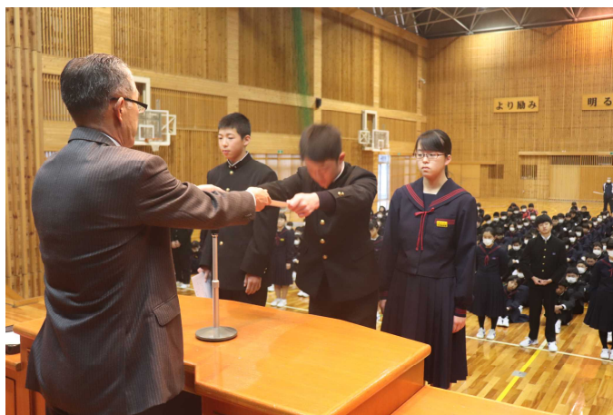
【3学期学級委員の任命式】

また、今のクラスで共に学習したり、生活したりできるのもあと僅かです。3学期の学級委員を中心に、思い出に残るクラスとなるよう「絆」を一層深めてほしいと思います。