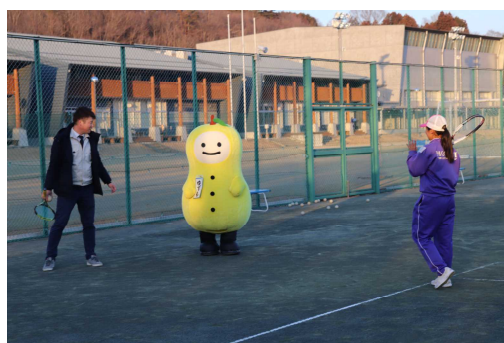
【ゆずもが町PR動画撮影に】

最後になりますが、保護者の皆様には、茂木中に対しての惜しみない、ご支援、ご協力をいただき、ありがとうございました。また、これからも教職員と保護者、地域が一体となって子どもたちの成長を支援することをお願いし、今年度最後の学校だよりとさせていただきます。