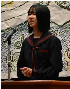
英語スピーチ 〇〇さん