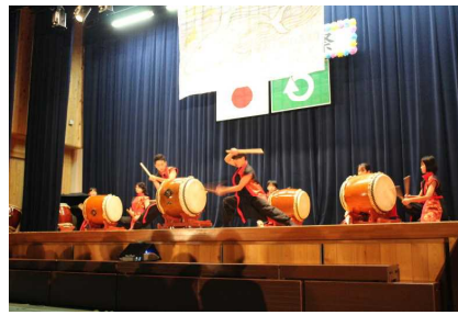
とりを務めた魂鼓(ここ)の皆さん