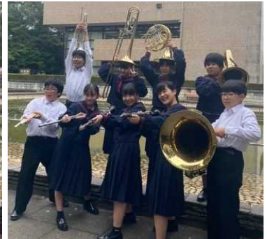
左から3年生、2年生、1年生 「白虎繚乱~なれし御城に残す月影~」で東関東出場に続き準大賞に輝く!