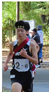
アカー〇〇さん・〇〇さん