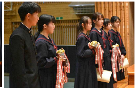
合唱コンクール最優秀賞学級の表彰