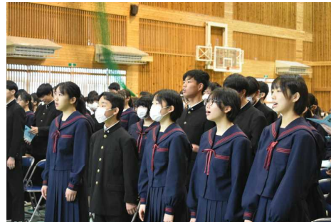
全校合唱「茂木町民の歌」