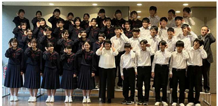
「聞こえる」表現力豊かに歌い上げた特設合唱部

特設合唱部は夏からの練習の成果を発揮し、銀賞を受賞しました。また、吹奏楽部は今までの活動の集大成として臨み、見事準大賞に輝きました。応援ありがとうございました。