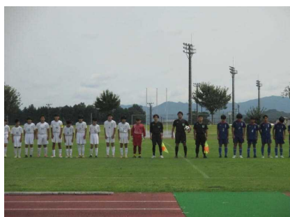
2回戦 対真岡中 左が本校