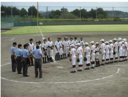
決勝 対久下田中6-4で勝利 右が本校