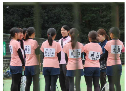
予選リーグ 対真岡西中を前に