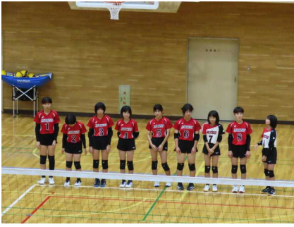
予選リーグ 対真岡西中