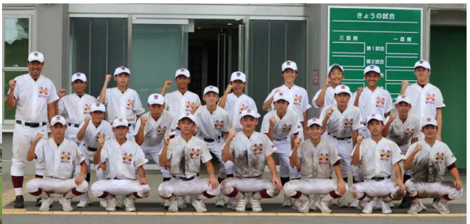
全力を出し切った選手たち(準々決勝戦後) ←J:COMスタジアム土浦(電光掲示板には球速も表示)