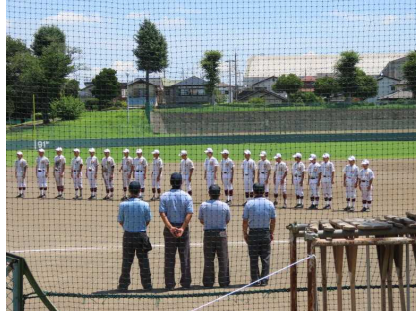
登録メンバーの皆さん