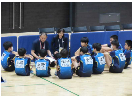
卓球男子団体第5位