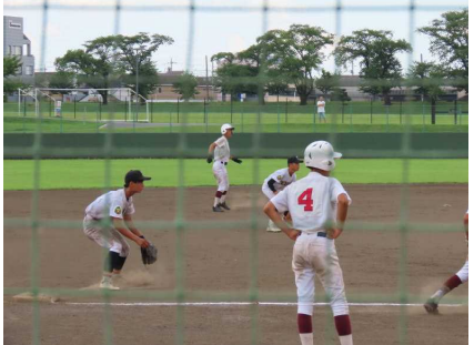
代表決定戦 対湯津上中 攻撃中