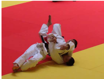
柔道個人戦第5位 ○○選手(上)