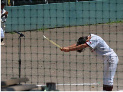
野球3位表彰式 主将 ○○選手