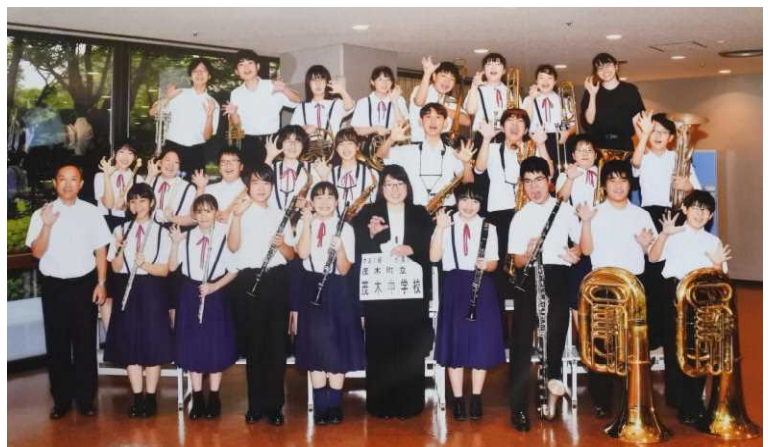
県吹奏楽コンクールでの演奏を終えて満面の笑顔

演奏曲である「白虎繚乱～なれし御城に残す月影～」は、会津藩を守るため果敢に戦った白虎隊や会津藩士の誇り高き武士の精神を称えるためにつくられたそうです。生徒たちは曲に乗せられた思いを豊かに表現することができました。