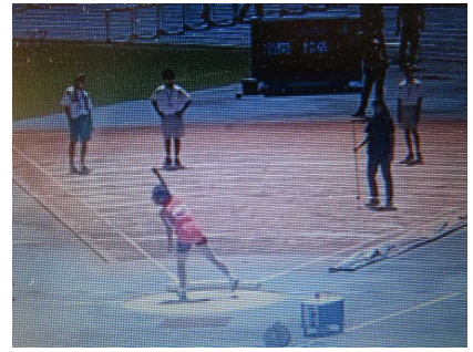
陸上1年女子砲丸投5位○○選手