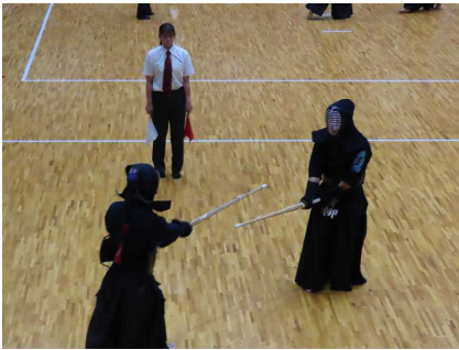
剣道個人戦 ○○選手(左)