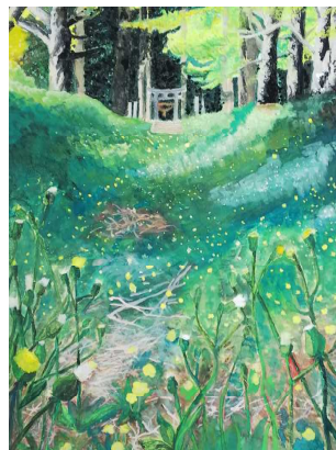
【鎮守の森へつづく道】 特選 1年 糸井かさ音 特選 3年 豊口溪太