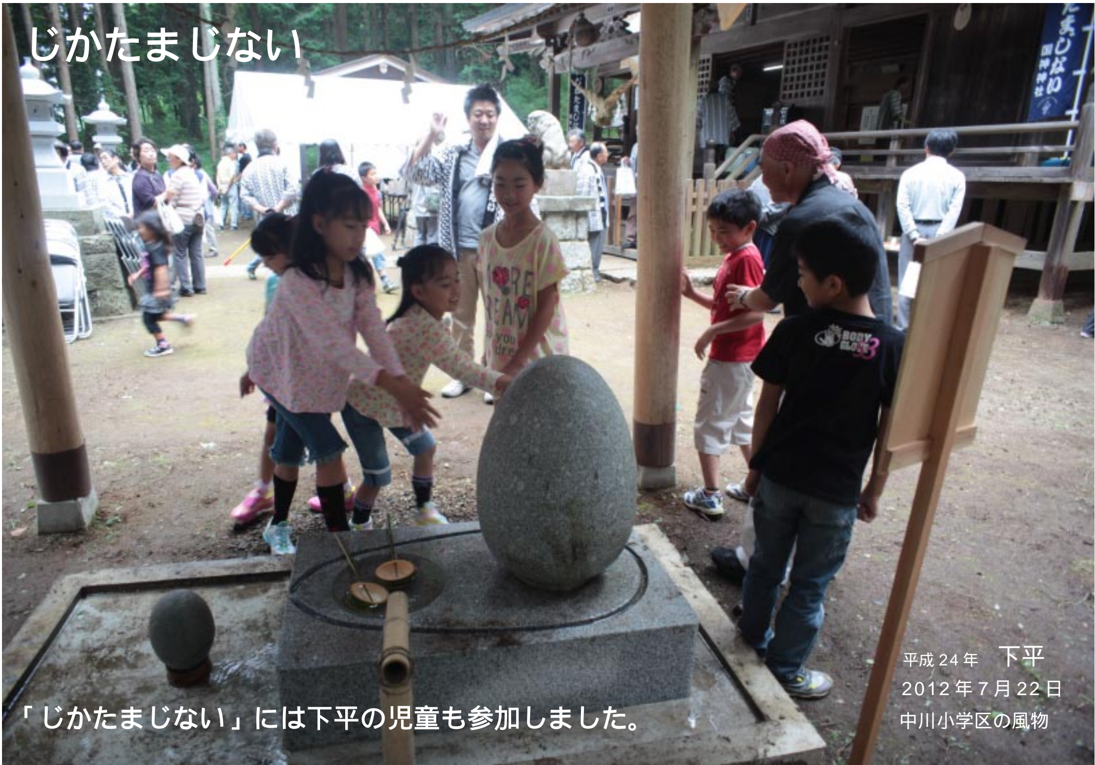
「じかたまじない」には下平の児童も参加しました。