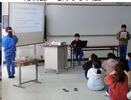
業間（理科発表リハーサル）