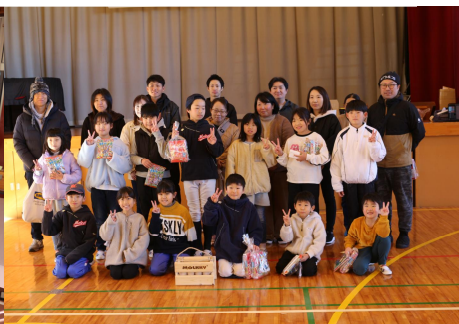
育成会 モルック大会