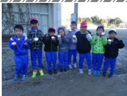
1年生 生活科「氷づくり」

「自分の命は自分で守る」児童の育成のため、今後も安全教育に努めていきたいと思っています。