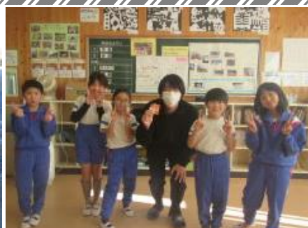
2年生 音楽（教職ボランティア）