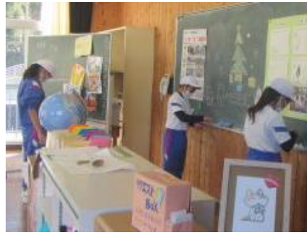
5年生 家庭科「学校のそうじ」