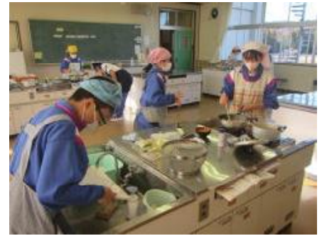
6年生 家庭科「調理実習」