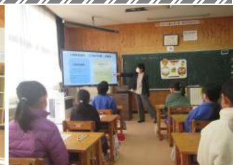
3年生 学級活動「食に関する指導」