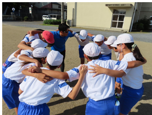
開会前に6年生全員で円陣を組みました。

保護者の皆様におかれましては、早朝よりお集まりいただき、準備や親子種目への参加、後片付けと御協力をいただき、改めて心より感謝申し上げます。