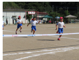
ドリムソフトバレー・3年生