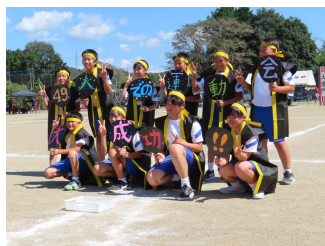
中小ソーラン2025・6年生