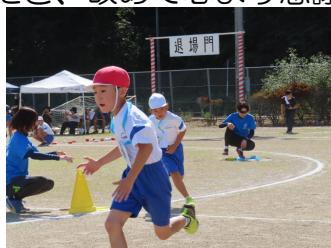
リバーボールはケットモンスター・1年生