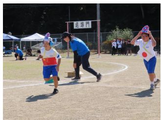
中小ミニ万博・4年生