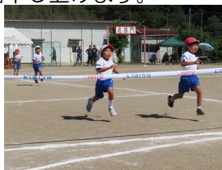
ゴールをめざして・2年生