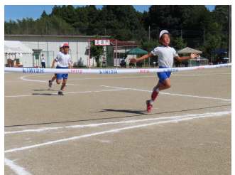
力の限り全力疾走・5年生