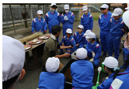
5, 6年生 種芋蒔き