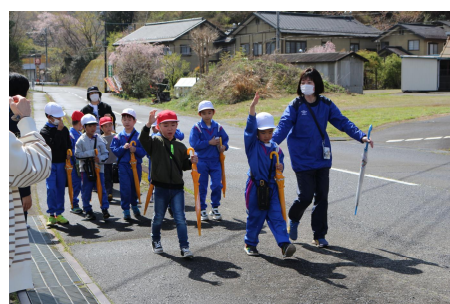
交通安全教室（歩行訓練）