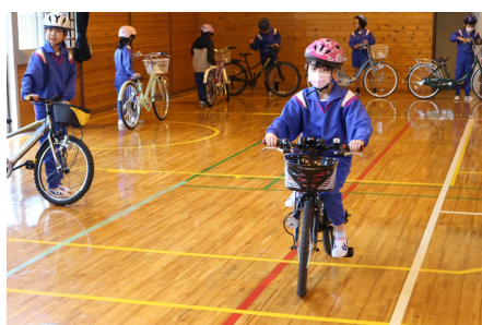
交通安全教室（自転車教室）