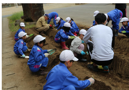
3, 4年生 種芋蒔き