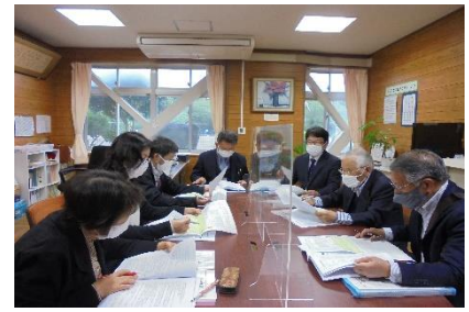
学校運営協議会の様子