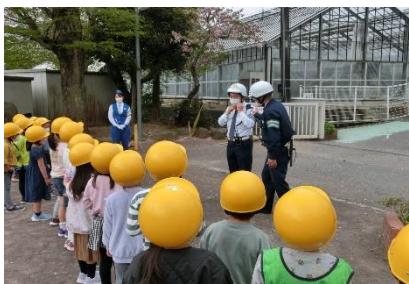
1年生 交通安全教室

ゴールデンウィークで一休みではありますが、6月4日(土)には運動会が控えています。御家庭・地域の皆さま方には、引き続き子供たちへの支援をよろしくお願いいたします。