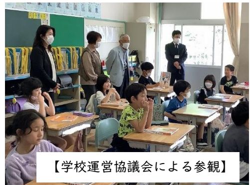
【学校運営協議会による参観】

さて、子供たちが楽しみにしている運動会が、6月3日（土）に予定されています。今年度は、コロナ前の通常開催を基本として、全校でプログラムを進めていきます。午前中にすべての競技を終え、給食終了後5時間目には片付けやクラス毎の振り返りまで行う計画です。ゴールデンウィーク明けからは、運動会の練習も始まります。保護者の皆様には、引き続き子供たちの健康管理と御支援をよろしくお願いいたします。