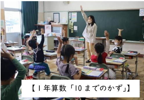
【1年算数「10までのかず」】

4月21日に行われた参観会、引き取り訓練では、お忙しい中御来校いただきまして、誠にありがとうございました。御家族の皆様に参加していただき、頑張る姿を見せようと一生懸命授業に取り組む子供たちの表情はとても輝いていました。