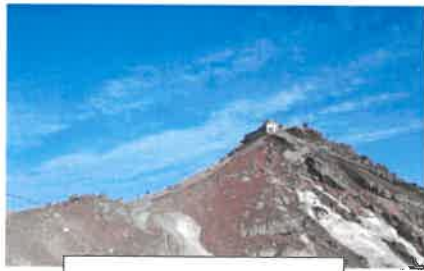
『てっぺんを目指して』