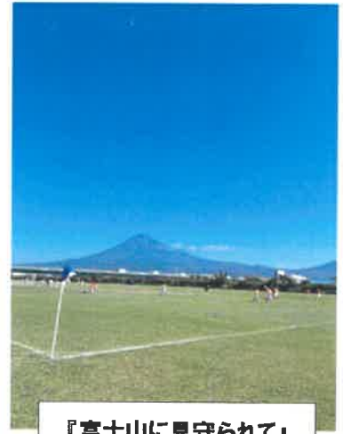
『富士山に見守られて』