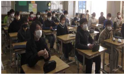
冬休み明け授業再開