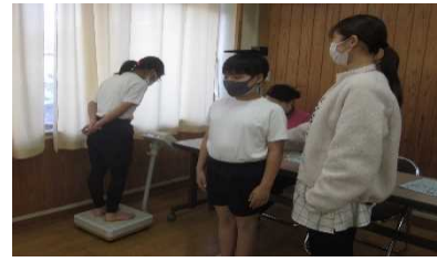
冬休み明け発育測定