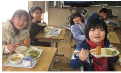
ふるさと給食の日