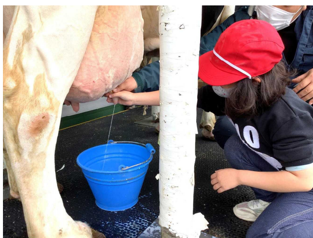
牛の乳搾り体験をさせてもらいました