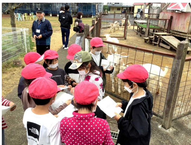
丹那小の児童が牛乳工場やオラッチェを案内してくれました