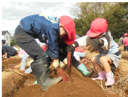
10/31 サツマイモの収穫