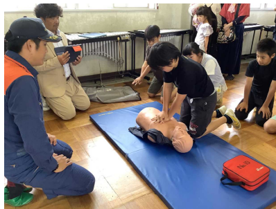
10/16 学校保健委員会(5,6年)