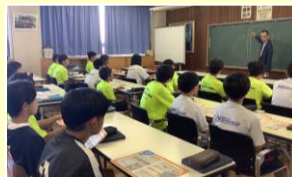
自転車講習会の様子

「平日から一緒に練習ができてうれしいです。」 「自転車は普段から乗り慣れているので、とても楽になりました。」