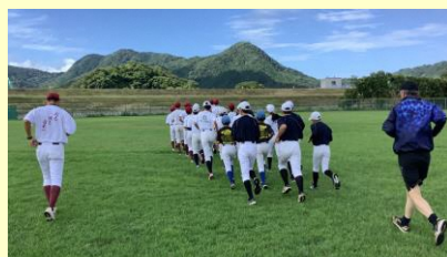
↑野球 ↓ソフトボールの様子

第4回以降は、現在参加者募集中です!みしまGigaポータルサイトにチラシを掲載してありますので、ご覧ください。