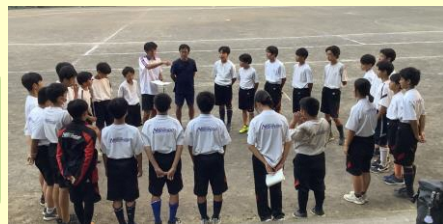
合同練習(平日)の様子