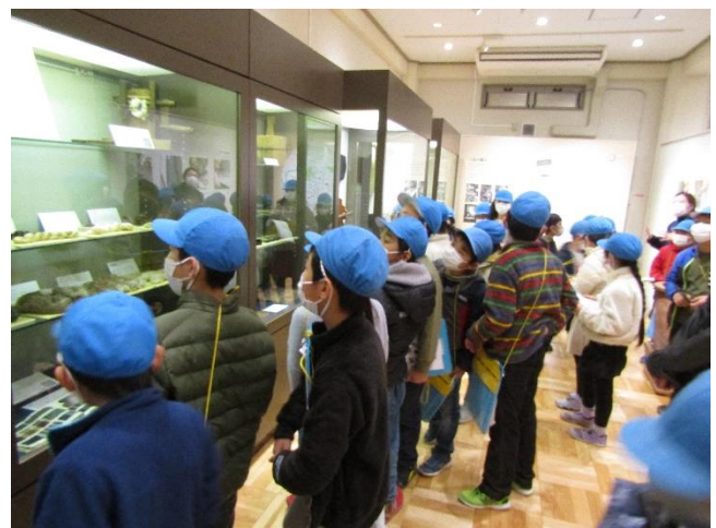
1/13 郷土資料館への見学（3年生）