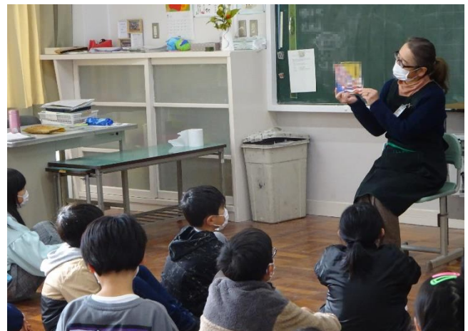
1/13 市立図書館 司書によるブックトーク