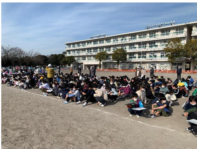
1/6 火災想定避難訓練