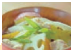
具だくさんの鶏汁