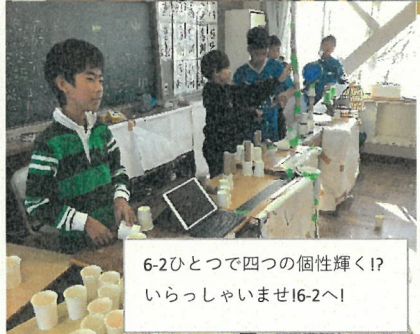
6-2ひとつで四つの個性輝く! いらっしやいませ!6-2へ!