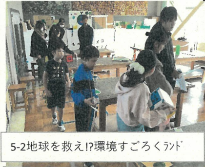
5-2地球を救え!環境すごろくランド