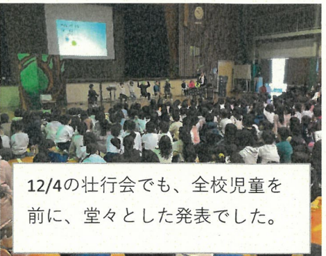
12/4の壮行会でも、全校児童を前に、堂々とした発表でした。