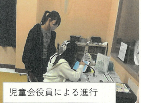
児童会役員による進行