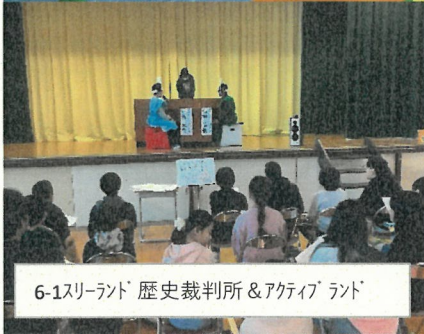
6-1スリーランド 歴史裁判所&アクティブランド