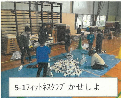
5-17フィットネスクラブ かせしよ