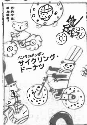
『パンダのポンポンサイクリング・ドーナツ』 (野中終・作/理論社)