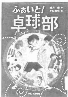
『ふあいと! 卓球部』 (横沢彰・作/新日本出版社)