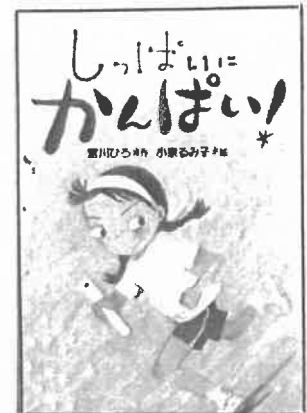
『しっほいにかんぱい!』 (宮川ひろ・さく/童心社)