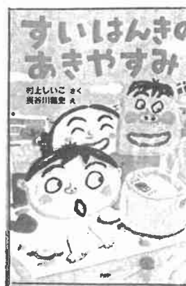
『すいはんきのあきやすみ』 (村上しん・さく/PHP研究所)