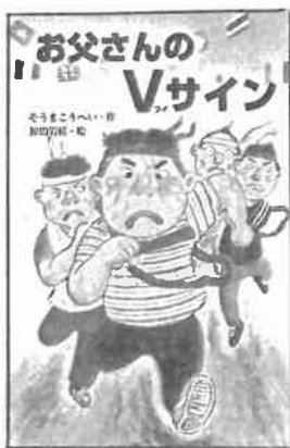
『お父さんのVサイン』 (そうま こうへい・さく/小峰書店)