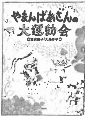
『やましばあさんの大運動会』 (富安陽子・作/理論社)