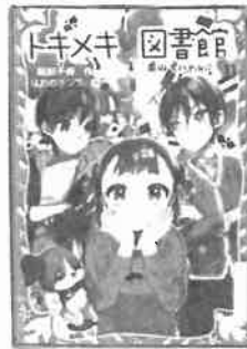
『トキメキ図書館 ①』 (服部千春・作/講談社)