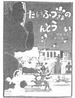
『だいつつさまの うんどうかい』 (荻田澄子・さく/アリス館)

ひがし小がっこう としょつだより (ていがくねんとしょつよう) れいわ4(2022)ねん5月