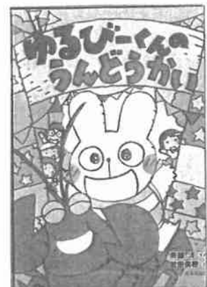
『ゆるびーくんの うんどうかい』 (斎藤 洋・さく/ほるぷ出版)