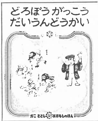
『どろぼうがっこう だいうんどうかい』 (かこ さとし・さく/増成社)

6月のうんどう会 かい におきて、れんしゃうが ほん はじまりました。 そこで あめ 今回は、スポーツする本 ほん をあつめてみました。 雨でれんしゃうできない日 ひ などに、よんでみませんか。