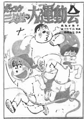
『ズッコケ三人組の大運動会』 (那須正幹・作/ポプラ社)