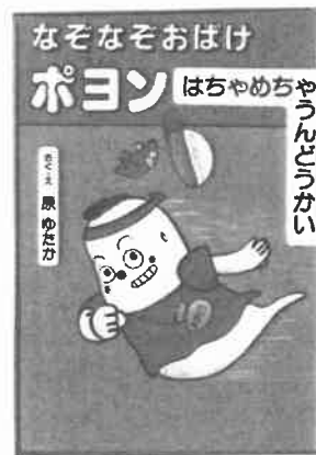
『なぞなぞおぼけ ポヨン はちやめちや うんどうかい』 (はら やすか・さく/くもん出版)