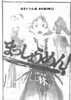
『まっしゅうめん!』 (あさだりん・作/偕成社)