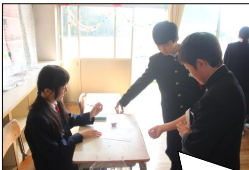
アルコールパッチテスト中です。

保健委員会で健康部門の発表について計画しています。文化祭当日は、ぜひ遊びに来てください。現在、グループごとに協力し合い掲示物を作成しています。