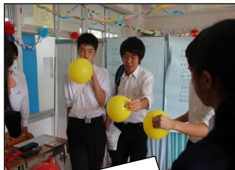
風船をふくらまして肺活量を調べています。