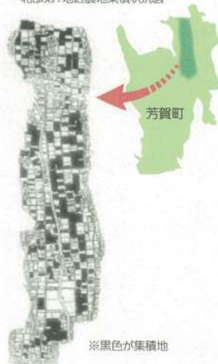
(図1) 平成28年度 北部第1地区農地集積状況図