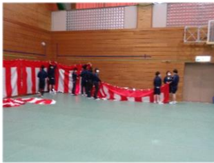
【入学式準備の様子】

4月7日（金）に準備登校が行われました。新学年への期待からか嬉しそうな顔で登校してきました。新3年生は入学式の式場準備を、新2年生は学校全体の掃除を担当してくれました。クラス発表では歓声が沸きました。学年だよりで自分の名前を確認し、新しい教室へと移動。新年度を迎えて新しい先生、新しい仲間との生活が始まります。出会いを大切に、1年間協力して学校生活を送りましょう。皆さんが一生涯懸命に取り組んでくれたおかげで、新入生を迎える準備ができました。ありがとうございました。