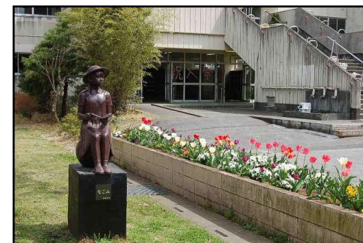
緑中のシンボル「なごみ」像