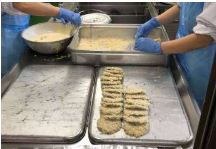
「黒はんぺん」に衣をつけます。