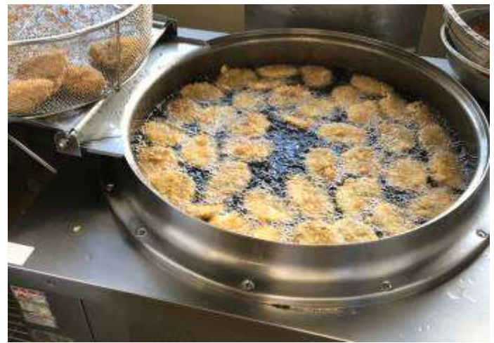
油でカラッと揚げます。