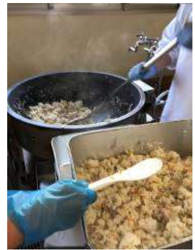
「ねぎ塩ごはん」も新メニュー。にんにくの香りと、レモンの酸味がきいています。