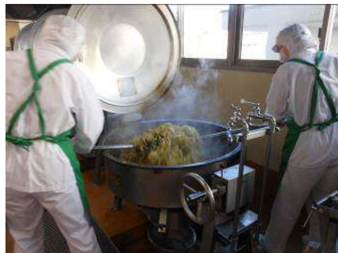
野菜をたっぷり使うので、二人がかりで炒めます。