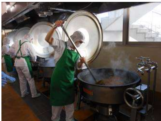
「焼きそば」は学年別に一釜ずつ調理しました。