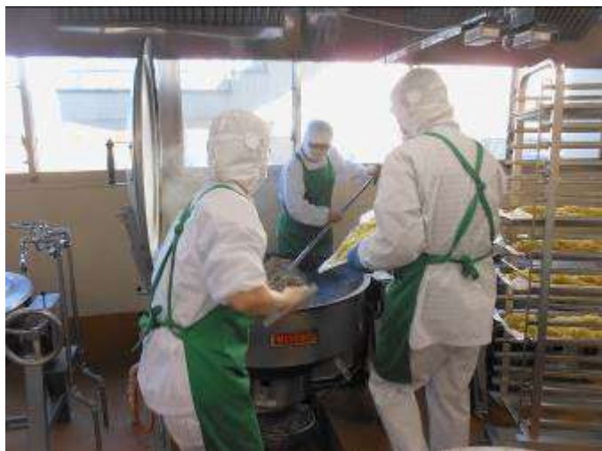
蒸した「麺」を加えます。