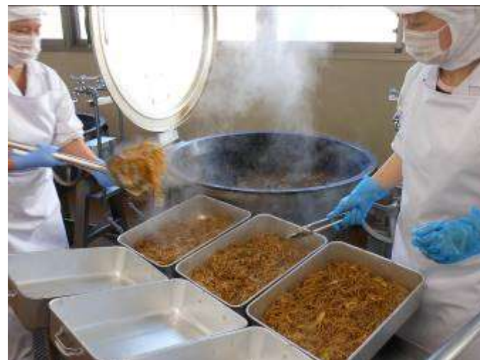
熱々のうちに配食します。