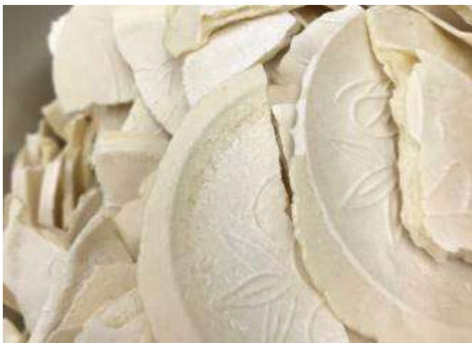
これがせんべい汁に使う「せんべい」です。