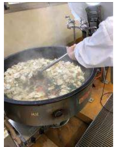
野菜を煮えたら、かつお節のだし汁を入れ、調味料を加え、最後に「せんべい」を入れて出来上がりです。