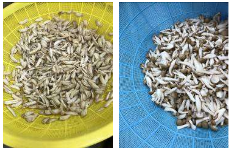
ごぼう、しめじなど野菜も加えます。