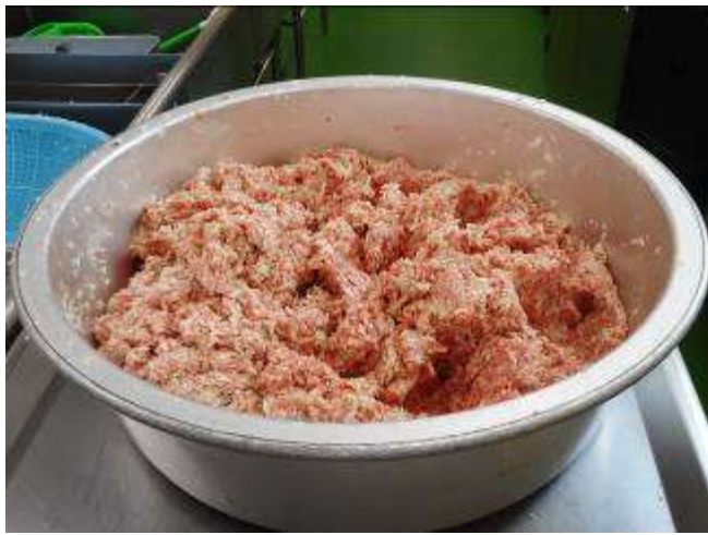
具の量は全体で40kg。混ぜるのも大変です。