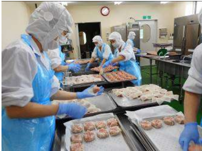
しゅうまいの皮で包みます。