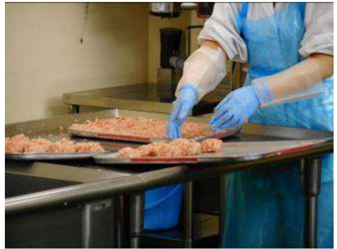
ひとり分ずつ、丸めてお団子にします。