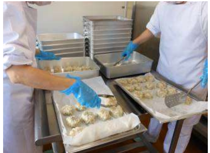
クラス分けをします。熱々です。