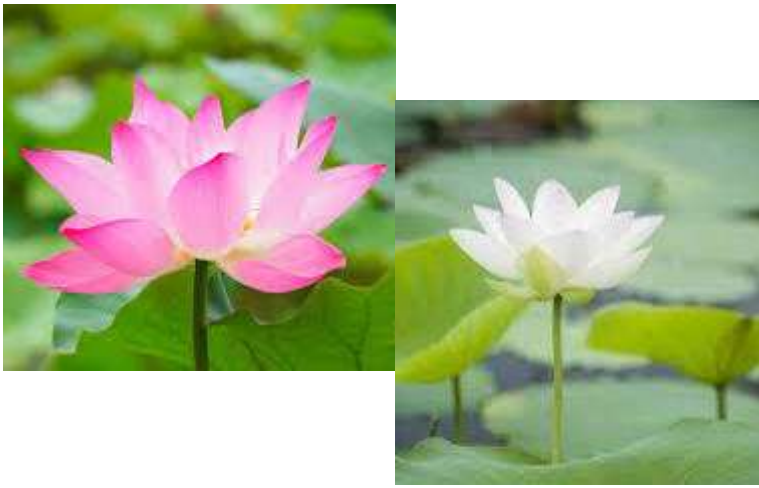
これが「蓮の花」です。