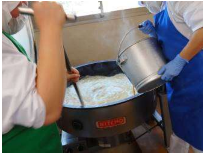
卵をゆっくりと流し入れます。