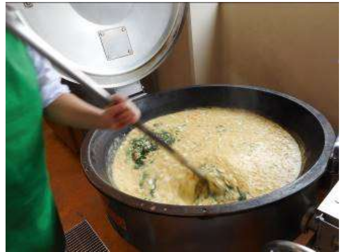
最後にほうれん草を加えて出来上がり。