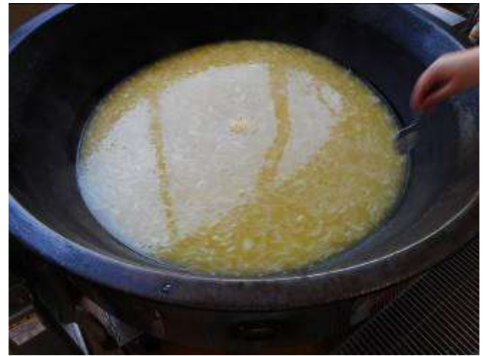
とうもろこしが入って、きれいな黄色になります。