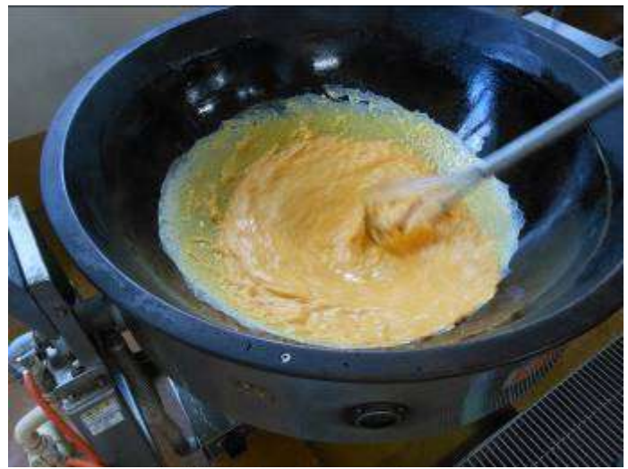
「いりたまご」は焦げないように注意深く調理します。