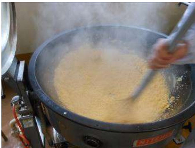
固まってきたら、時間との勝負。