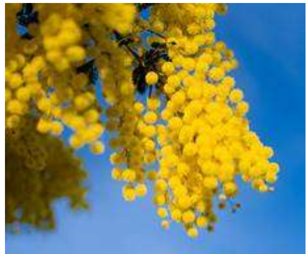
これが「ミモザ」の花です。