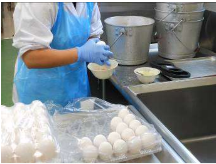
大量の卵を片手で割ります。おみごと！