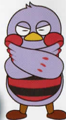
埼玉県マスコット 「さいたまっち」