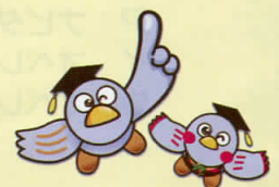
埼玉県のマスコット コバトンとさいたまっち

「受検票」と、受検者本人であることを証明する書類（生徒手帳などの身分証明書又は健康保険証等）が必要です。