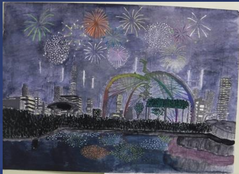
春日部景観絵画コンクール 金賞「公園橋から見える花火」