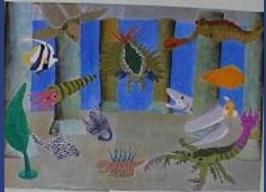
春日部景観絵画コンクール 金賞「未来の龍Q館の中で」