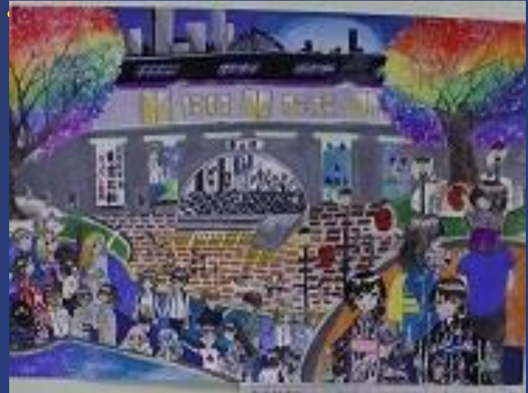
春日部景観絵画コンクール 金賞「未来の春日部 Rainbow City」