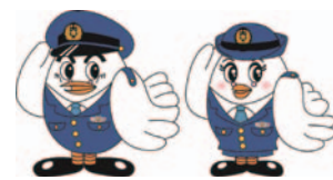
埼玉県警察マスコット「ポツポくん」「ポボ美ちゃん」