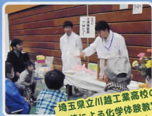
埼玉県立川越工業高校の 生徒による化学体験教室 (川越産業フェスタ)

埼玉県では、 教育に関する理解を 一層深めていただくため、 「彩の国教育の日」を設け、 学校・家庭・地域が 一体となった取組を 推進しています。