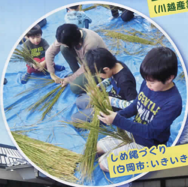
しめ縄づくり (白岡市:いきいき体験教室)