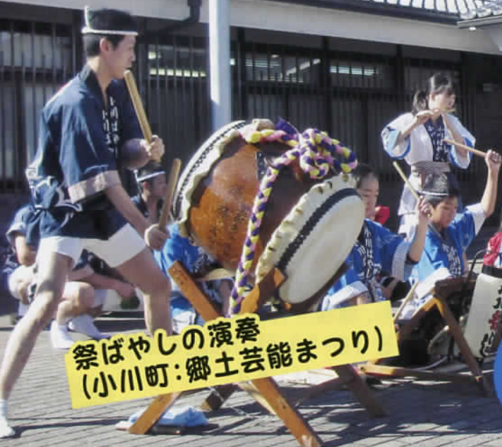
祭ばやしの演臺 (小川町:郷土芸能まつり)

お近くの学校・施設での 行事等に参加してみませんか。 詳しくはホームページを ご覧ください。