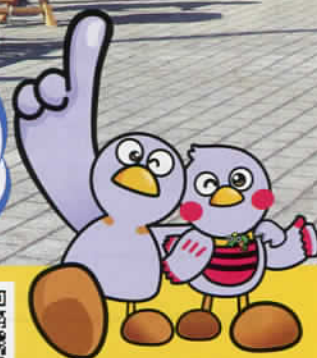
コバトン さいたまっち

お近くの学校・施設での 行事等に参加してみませんか。 詳しくはホームページを ご覧ください。