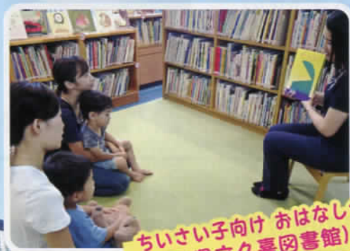
ちいさい子向け おはなし会 (埼玉県立久喜図書館)