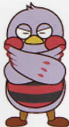
埼玉県マスコット 「さいたまっち」