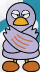
埼玉県マスコット 「コバトン」