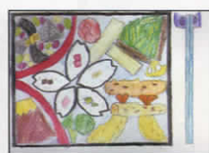
▲アイデア弁当原画 (昨年度の教育長賞)