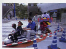
▲ミニ新幹線乗車体験