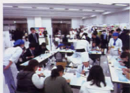
▲マジバン作り体験