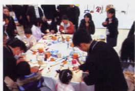
▲木を使ったものづくり