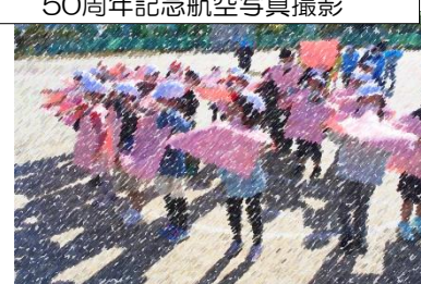
50周年記念航空写真撮影