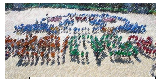
50周年記念航空写真撮影