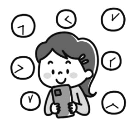
ちょうじかんれんぞく 長時間連続で

歩きスマホはけがや事故につながるおそれがあり、とても危険です。また、スマホを長時間使うことで、目が疲れたり睡眠不足になったりするなど、健康面での問題も出てきています。スマホと“ほどよい距離”を保って上手に付き合っていくために、以下のことを心がけてください。