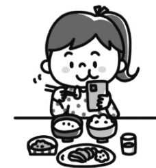
しょくじ 食事をしながら