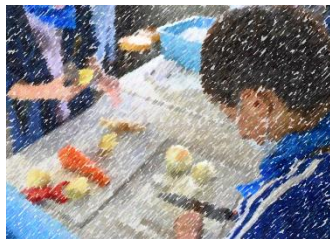
【5年生 林間学校の様子】

ます。5年生は林間学校を終え、自分たちで約束やマナーを守りながら主体的な行動を行い、現地での様々な体験を通して一回り成長した様子が伺えます。廊下には、全校児童の一字一字集中して書き上げた硬筆の作品が掲示しています。作品から個々の頑張りが伝わってきます。